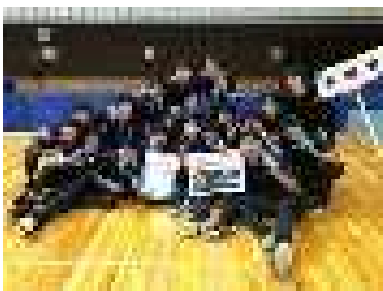
<バレーボール競技 (成年男子) >