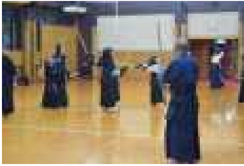
<武道教室（剣道教室）>