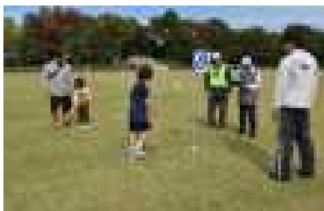
〈堀原運動公園：グランドゴルフ〉