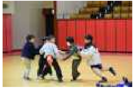
<スポーツ教室（キッズスポーツ教室）>