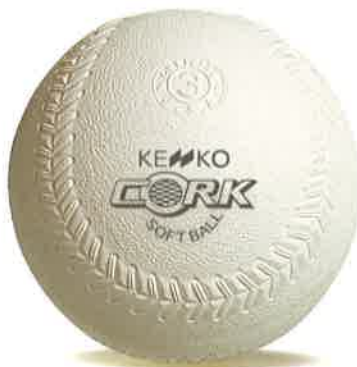
Softball (ソフトボール) (公財)日本ソフトボール協会検定球 ケンコーソフトボール 新ケンコーソフトボール1/2/3号・コルク芯 ケンコーソフトボール3号・カボック芯 ケンコーソフトボール3号革イエロー ケンコー学校体育ソフトボール検定3号 他