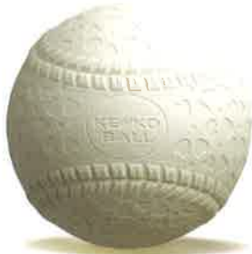
Baseball (野球) (公財)全日本軟式野球連盟公認球 ケンコーボール ケンコーボールM号 ケンコーボールJ号 他