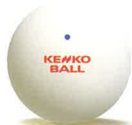
Soft-tennis (ソフトテニス) (公財)日本ソフトテニス連盟公認球 ケンコーソフトテニスボール ケンコーソフトテニスボール・ホワイト ケンコーソフトテニスボール・イエロー 他