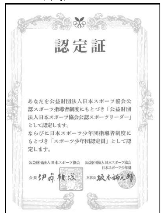
<認定証のイメージ>