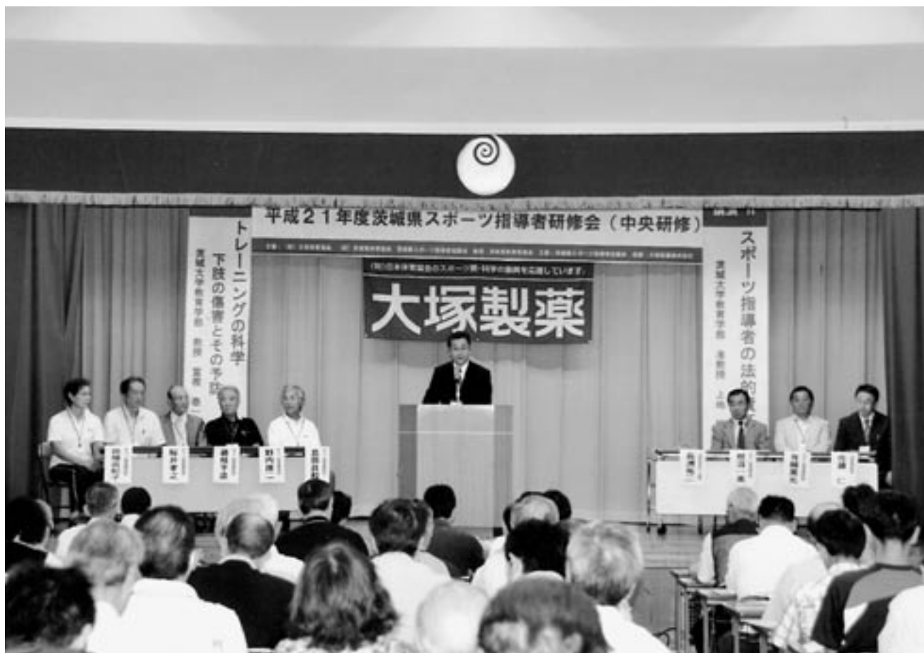
中央研修会 (H21. 8.30)