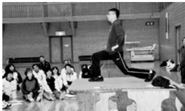
鹿行研修会 実技講習スナップ